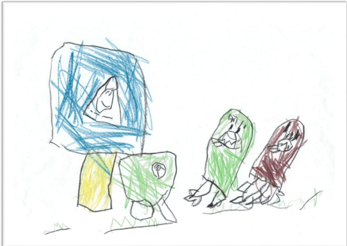
Trafikkskilt med fotgjengerovergang en grønn bil og to gutter - en med grønn genser og en med brun genser. Noah J.B