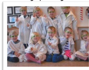
Forskergruppen, Ask barnehage 2015