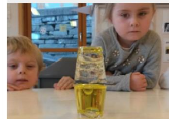
Forskergruppen, Ask barnehage 2015

Albert Einstein: «Det virkelige tegnet på intelligens er ikke kunnskap, men evnen til å forestille seg.»