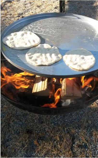
Polarbrød på bålpannen.