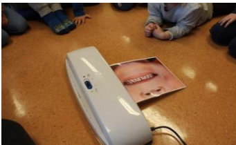
Bilder av tennene våre.