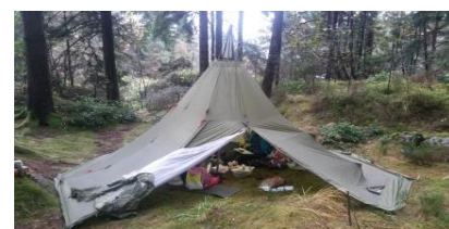
Lavvo tur til Solnes.