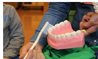
Vi har snakket mye om tannhelse.