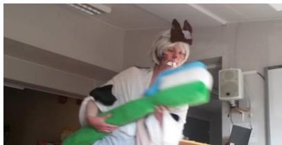
Vi fikk besøk av Flekk.