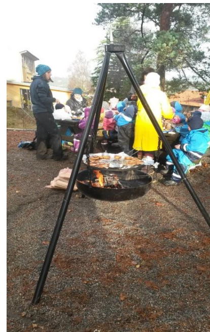
Lunsj på UFO-lekeklassen

Vi tok bilder av tennene våre, hengte de opp på veggen,