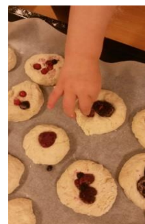
Mat til festen..